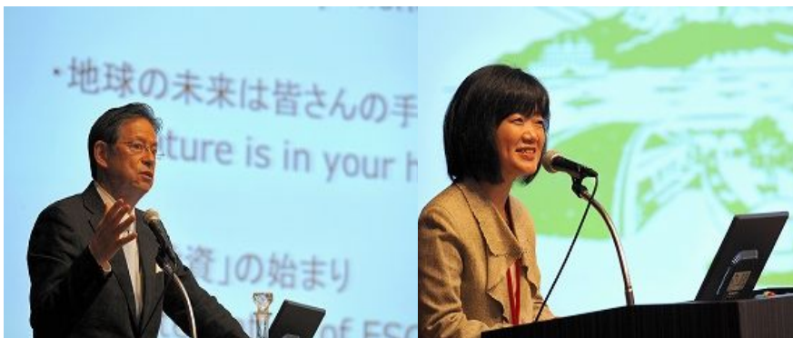
主题演讲“21世纪城市建设” 联合国环境规划署金融倡导部特别顾问 末吉竹二郎