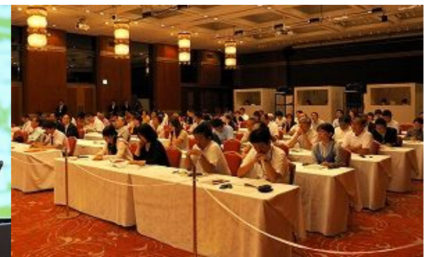
120位关心环境问题的热心市民旁听者们听得聚精会神